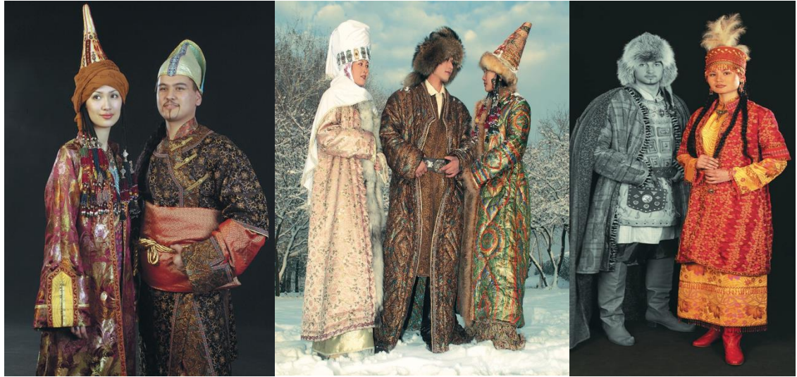
(Görsel 3) 7-9.y.y; 17. – 19 yy. Zengin Sınıfa Mensuplu Kazakların Milli Giysileri (M. Zhumagaliev).

Hammaddeden ipliğe, kumaştan giysiye kadar geçen tüm süreci içine alan genel bir kavram olan tekstil, bu yapısıyla bilim, teknoloji, zanaat ve sanat alanlarını kapsamaktadır. Endüstri Devrimi ile birlikte zanaat alanlarının yoğunluğu azalmış, teknik alanların yoğunluğu ise artmıştır. Tekstil alanında da diğer yaratım alanlarında olduğu gibi tasarımcıların tasarımlarını somutlaştırma aşamalarında en önemli fonksiyonlardan bir tanesi malzeme bilgisidir. Tekstil söz konusu olduğunda dokuma, örme ve dokusuz yüzeyler ana malzeme olarak tanımlandığından bu malzemelerin teknik özellikleri, fiziksel, kimyasal ve mekanik yapıları tasarımın en önemli özelliğini oluşturmaktadır. (Gürcüm, B. H. & Öztürk, Ö. 2020).