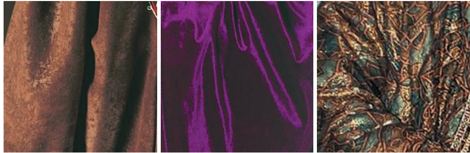
(Görsel 5) Barkyt (kadife) kumaş örnekleri.