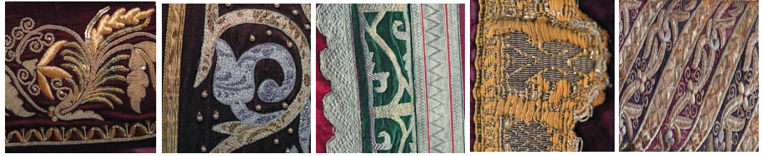
(Görsel 7). Altın iplikle nakış süsleme örnekleri.