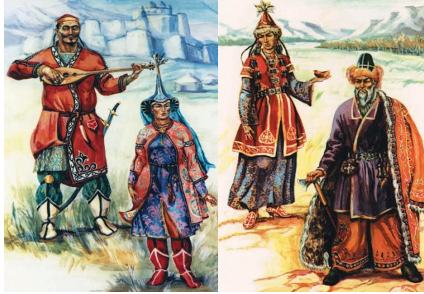
(Görsel 2) Antik Sakaların kıyafetleri. Kazak Milli Giysisi, XVIII. yy. (Bast'ın illüstrasyon çalışması)

ipek, saten ve simli kumaşlar; gündelik giysilerde ise pamuk, bez, çuha, basma kumaşlar kullanılmıştır (Yergeshova S, 2015)