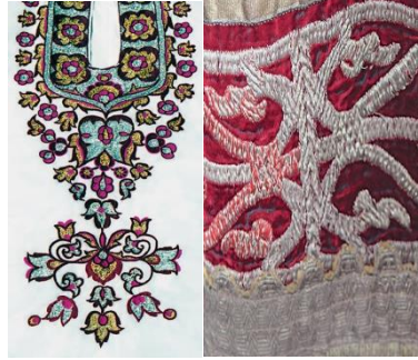
(Görsel 8). Bitkisel motifli renkli iplikli bezeme.

Koleksiyonlarında Kazak göçebe kadınının sözsüz ifadeleri olan motiflerden esinlenen yerel tasarımcılar, tasarladığı kıyafetlerde kullandığı renk ve motiflerle yansıtmaktadır. Kazak kadınının yaşadıkları dönemde bolluk, bereket, doğurganlık, evlilik hikâyesi gibi duygu ve düşüncelerini aktardığı sözsüz ifadelerini yani motifleri ise stilize edilmiş eşkenar dörtgen, kare, üçgen, tarak çizgi gibi bezemelerle, tel kırma, applike, kanaviçe teknikleriyle aktarmaktadır. Çalışmada, moda tasarım bölümünde, eğitim gören 3- sınıf öğrenciler tarafından geliştirilen geleneksel modern giysiler proje çalışması olarak yapılmıştır. Günün trendleri ve incelenen yerel tasarımcıların koleksiyonları doğrultusunda yeni, modern tasarımlar yapılmıştır. Ayrıca geleneksel motifli kumaş kullanılmasına özen gösterilmiştir. Yapılan tasarımlar dikimi gerçekleştirilecek uygulanmıştır.