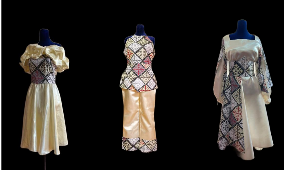
(Görsel 10) 'Alaşa' modern giysi koleksiyon örnekleri.