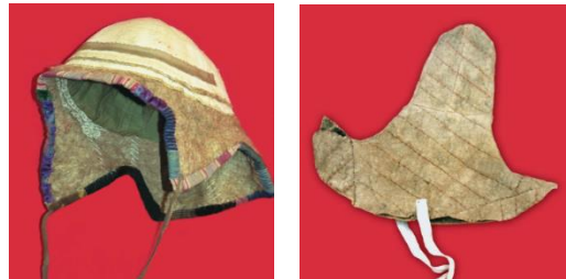
(Görsel 1) Deri çeşitleri.

Eskiden Kazak geleneksel giysiler sadece doğal ürünlerden koyun, deve, keçi gibi hayvan yünlerinden ve tilki, kurt, samur gibi av derilerinden dikilmiştir.