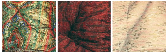
(Görsel 6) Parşa (parça) kumaş örnekleri.

19. yüzyılın sonu ve 20. yüzyılın başlarında Orta Asya'da yaşayan halklar göçebe yaşam tarzından yerleşik yaşam tarzına geçmeye başladı. Sadece hayvancılıkla uğraşanlar yarı yerleşik, yarı göçebe yaşam tarzlarını hâlâ koruyorlardı.