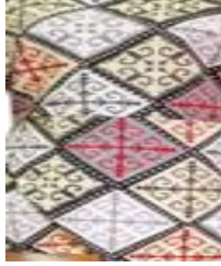
(Görsel 11) 'Alaşa' kumaşı.